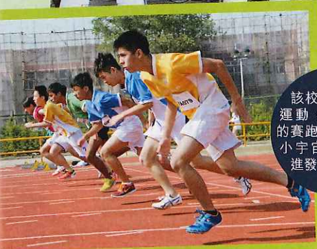
該校學生熱愛運動，在陸運會上發揮的賽跑比賽，向小宇宙進發。