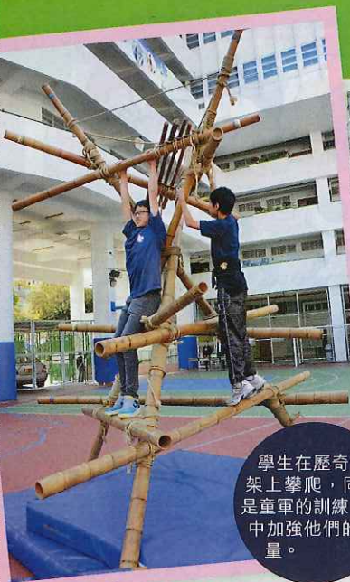
學生在歷奇竹架上攀爬，同樣是童軍的訓練，從中加強他們的膽量。