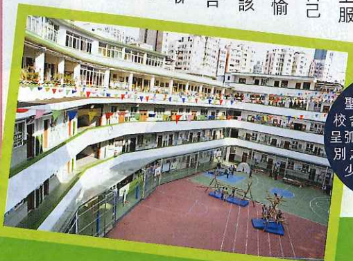
聖芳濟書院的校舍歷史悠久，並特呈別之設計，亦增添不少空間感。

作為一間歷史悠久的英文Band 1中學，聖芳濟書院一直貫徹以英語作授課語言的傳統，着力提升學生的英語水平。除了中文、中史和普通話科之外，其餘科目均以英語授課；加上，該校因應學生的能力，分組上課，還會為能力較弱的學生作小班分組教學，以增補學生的語文水平。同時為增加學生的英語會話能力，該校特設英語角，由外籍老師為初中學生主持互動的英語活動，並特設「英語公開論壇」、英語廣播站及海外遊學團，用以幫助學生建立英語說話和演說的