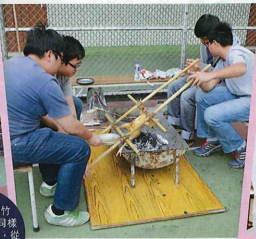
▲在中一簡介會當日，該校數位童軍學生在操場示範原野烹飪的做法，展現童軍所學的技能。