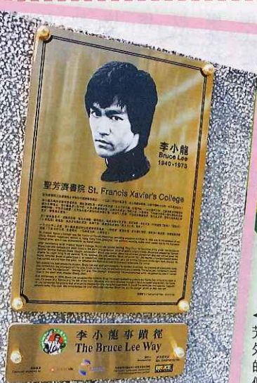
李小龍事蹟徑 The Bruce Lee Way