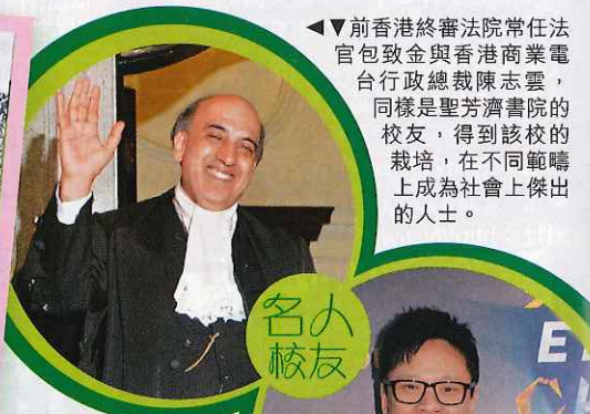
▲前香港終審法院常任法官包致金與香港商業電台行政總裁陳志雲，同樣是聖芳濟書院的校友，得到該校的栽培，在不同範疇上成為社會上傑出的人士。