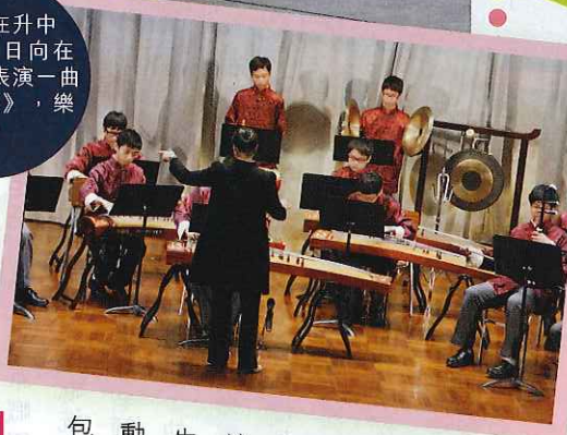
中樂團在升中簡介會當日向在場的家長表演一曲《將軍令》，樂聲澎湃。