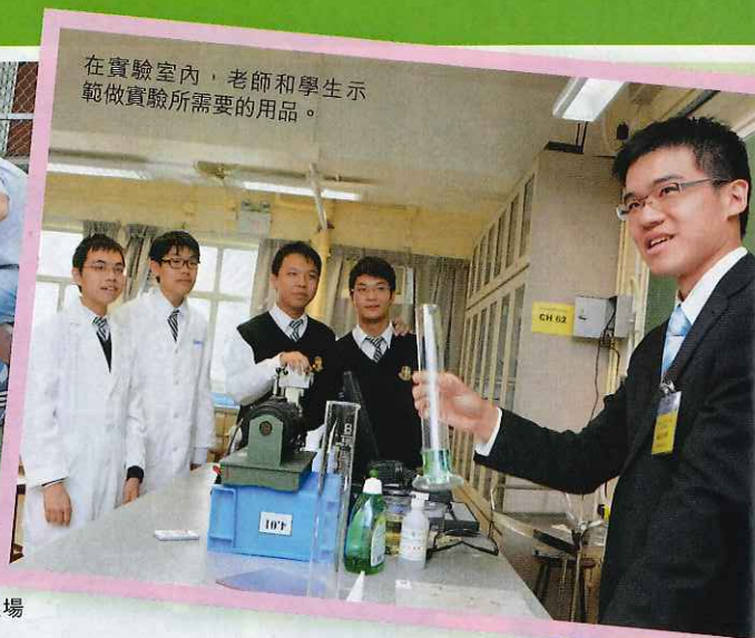
在實驗室內，老師和學生示範做實驗所需要的用品。