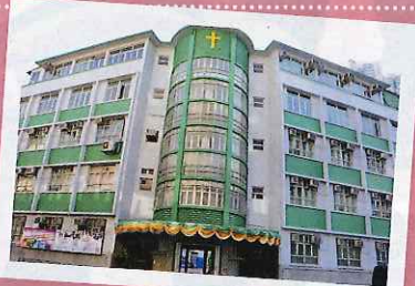
▲聖芳濟書院是一間近六十年歷史的天主教母校，備受區內的家長追捧。